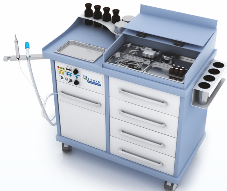
Energy plus 1100x590x1070мм