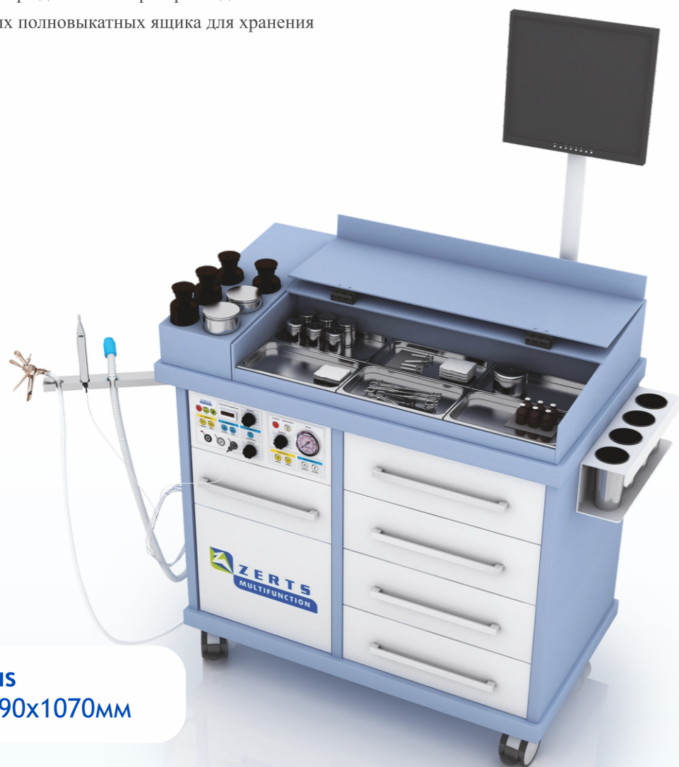
GIN Plus 1100x590x1070мм