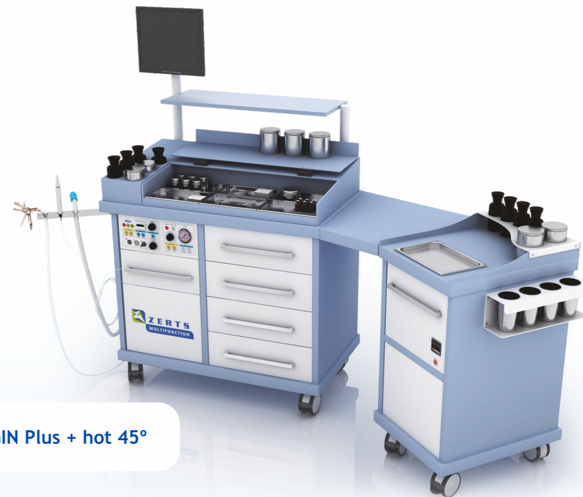
GIN Plus + hot 45°