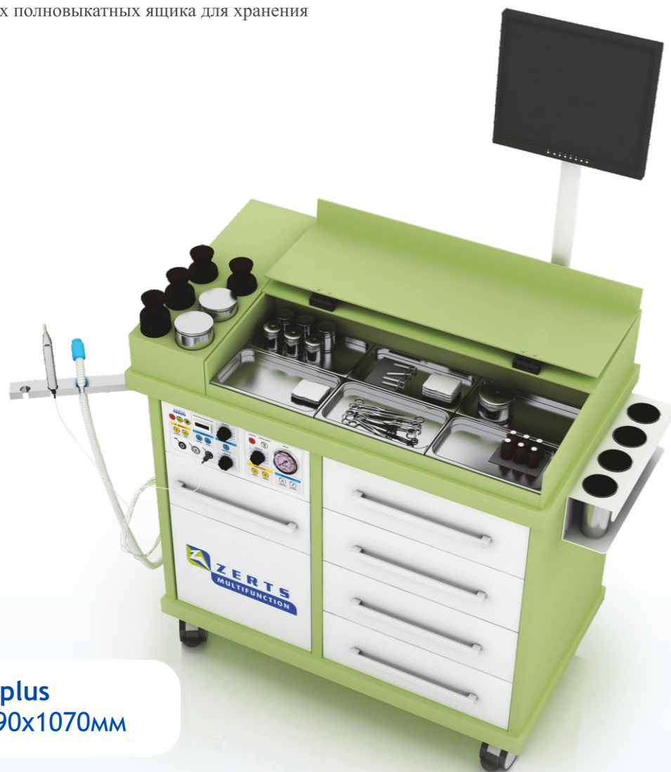
Procto plus 1100x590x1070мм