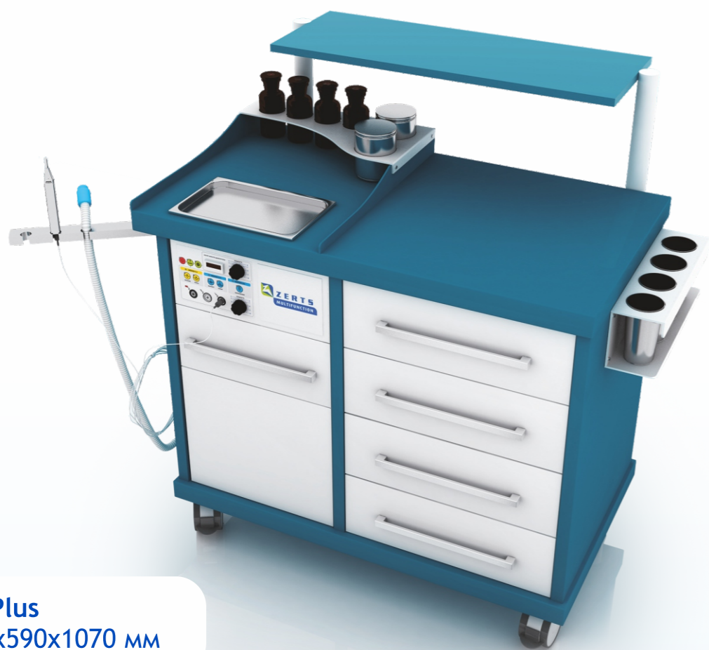
Uro Plus 1100x590x1070 мм