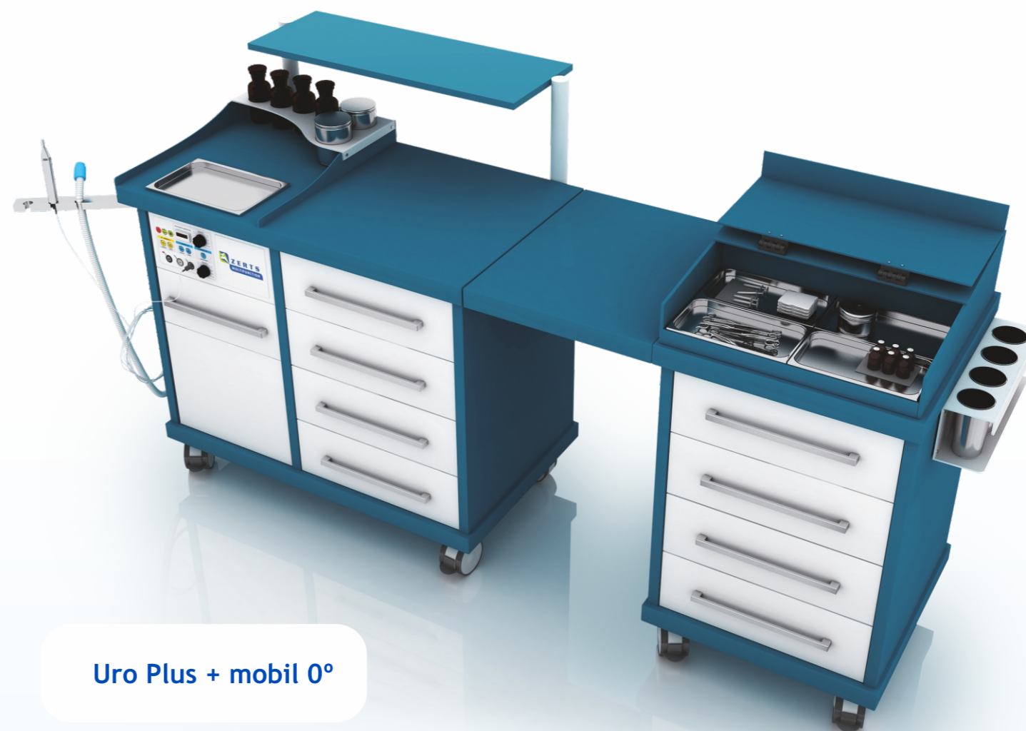
Uro Plus + mobil 0°