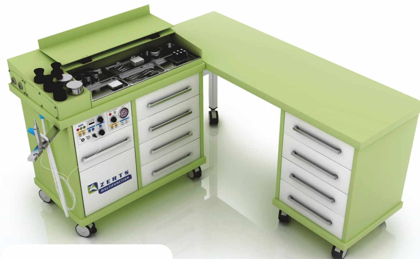
Procto Plus + mobil 90°