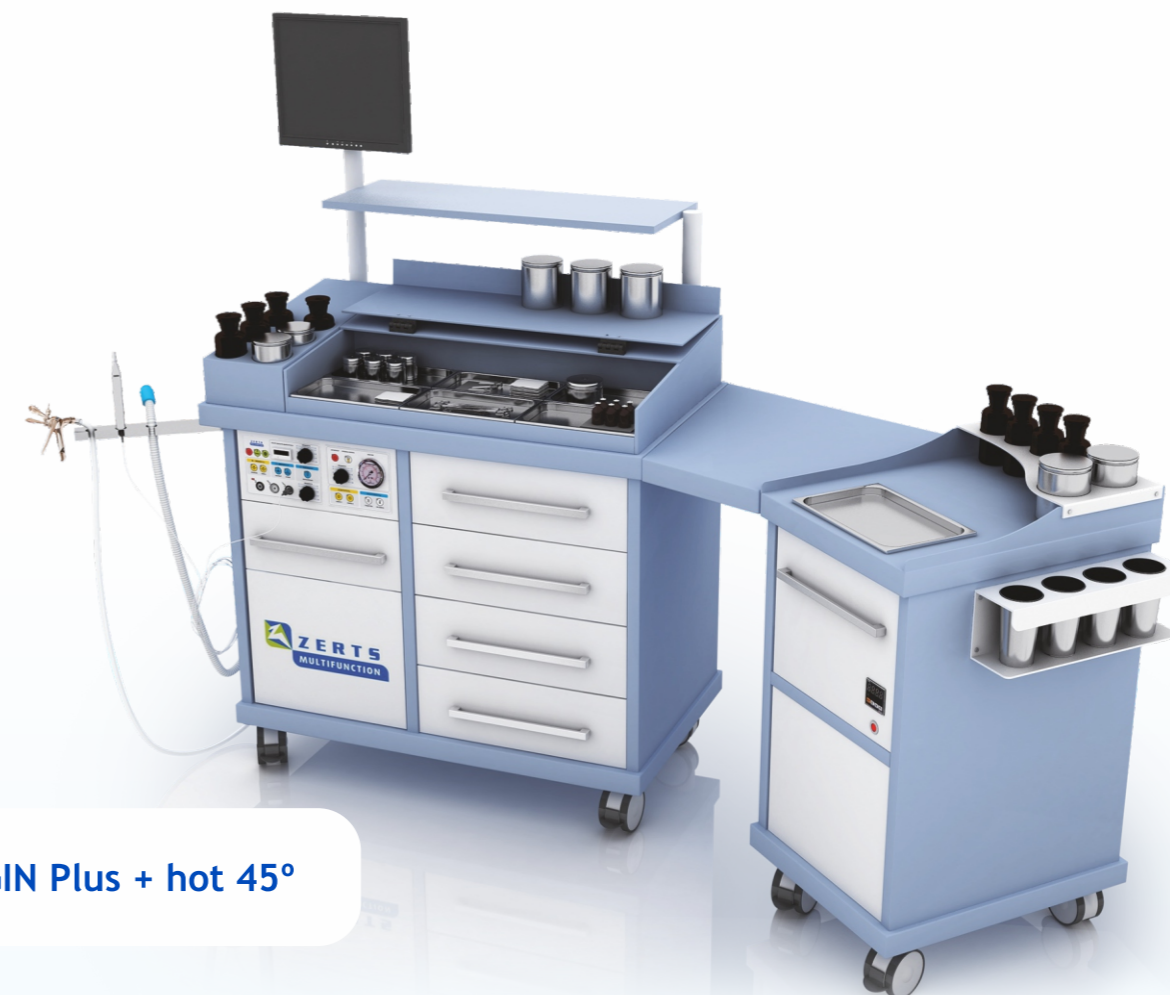
GIN Plus + hot 45°